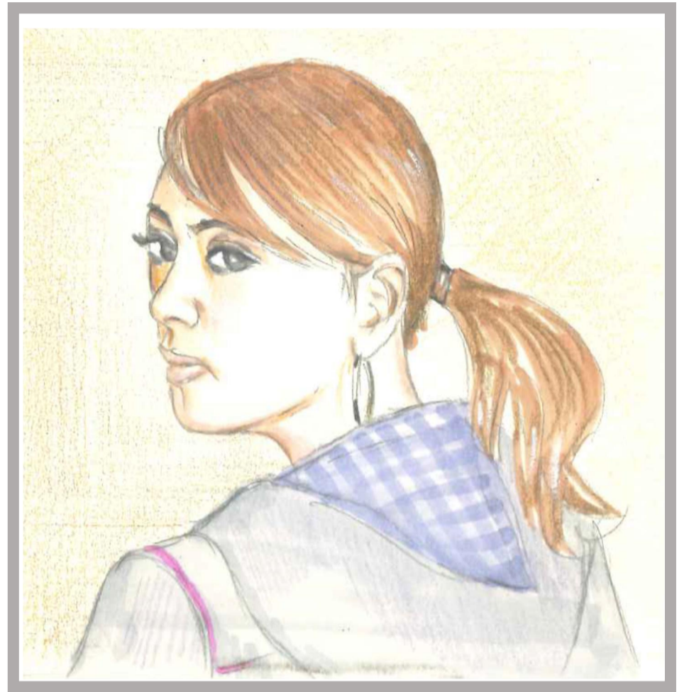
↑「忘れえぬ思い出」 K. S