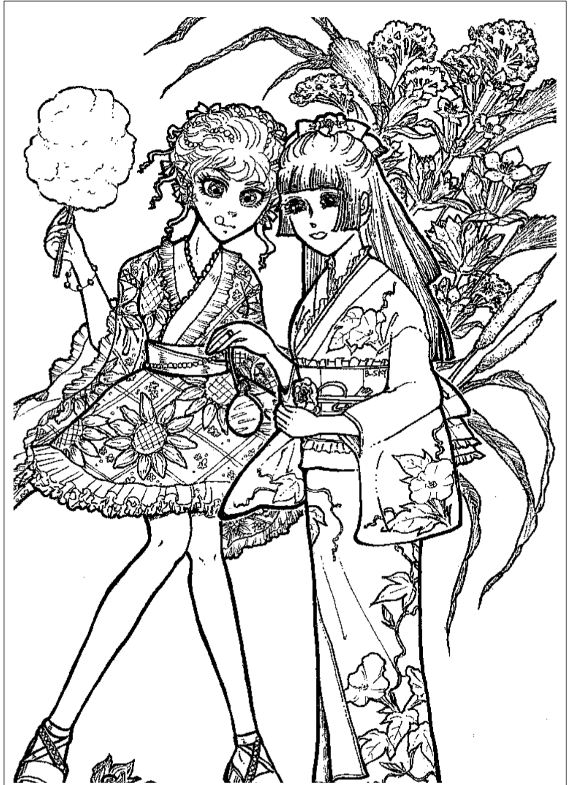
ペンネーム: フルースカイ