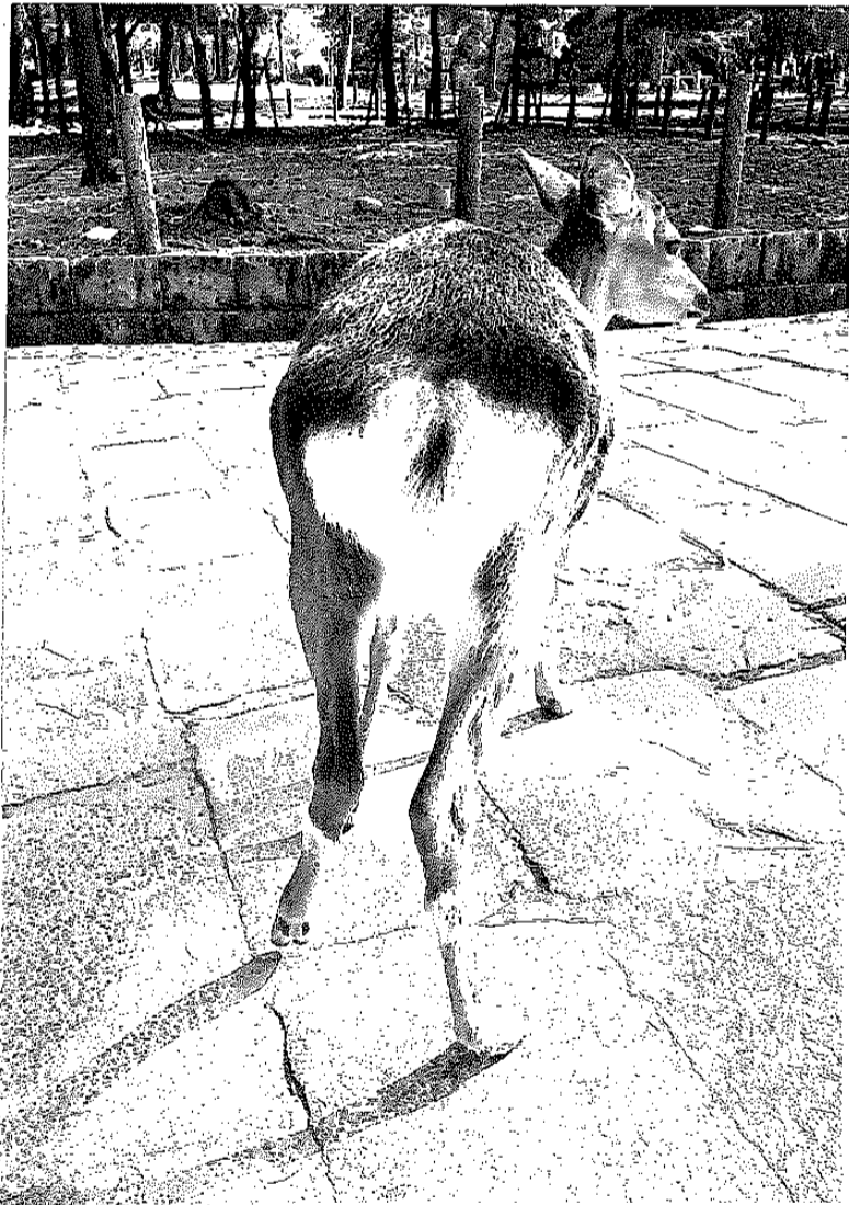
「ハート」ペンネーム：しい