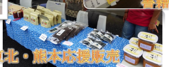
東北・熊本応援販売

8月26日(土)に第20回ふれんどりい祭を開催しました。当日は天候にも恵まれ、300名以上の方に来ていただきました。例年より100名以上多くの方に来ていただき大盛況でした♪